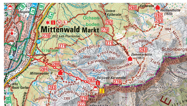
Ausschnitt aus der UK50-50 Werdenfelser Land

Radler kommen in der Region auch auf ihre Kosten. Füssen, Forggensee und Schloss Neuschwanstein lassen sich auf gut ausgebauten Fahrradwegen optimal entdecken. Das weltberühmte Schloss Linderhof und der Passionsspielort Oberammergau können gut mit dem Rad erreicht werden. Weitere Highlights dieser Karte: Das Königshaus am Schachen (auch Königsschloss) und der botanische Alpengarten sowie die Partnachklamm, die Burgruine Werdenfels und das Festspielhaus Neuschwanstein. Spiel, Spaß und Action für die ganze Familie gibt es im Kletterwald Garmisch-Partenkirchen, im Bogenparcours am Kolbensattel und bei der Sommerrodelbahn am Tegelberg.